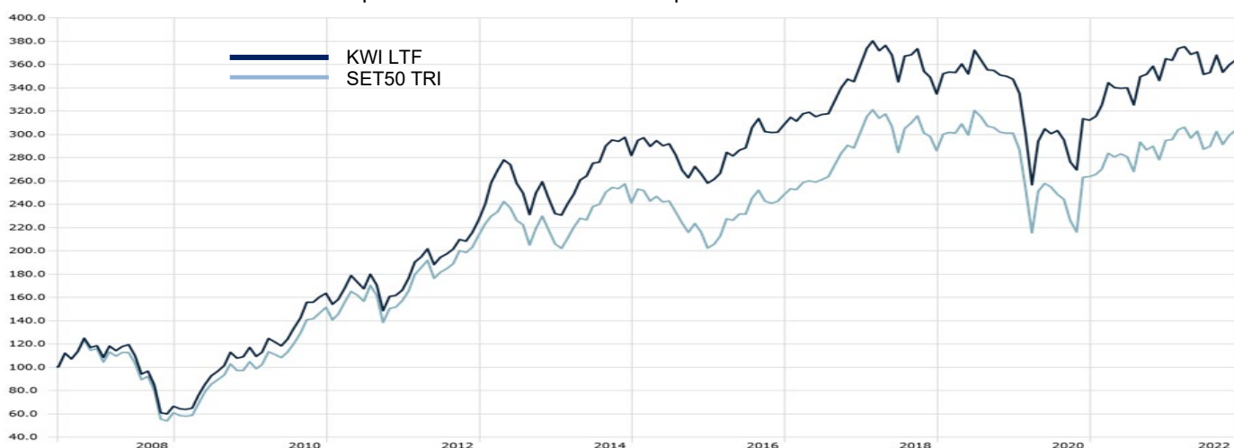
กราฟแสดงการเปรียบเทียบจากเงินลงทุน 100 บาท ตั้งแต่วันที่จัดตั้งกองทุน